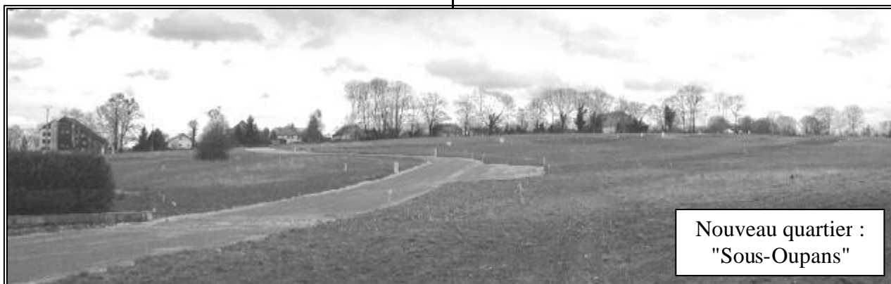
Nouveau quartier : "Sous-Oupans"

réseau d'assainissement qui fera l'objet d'une réfection courant 2003.