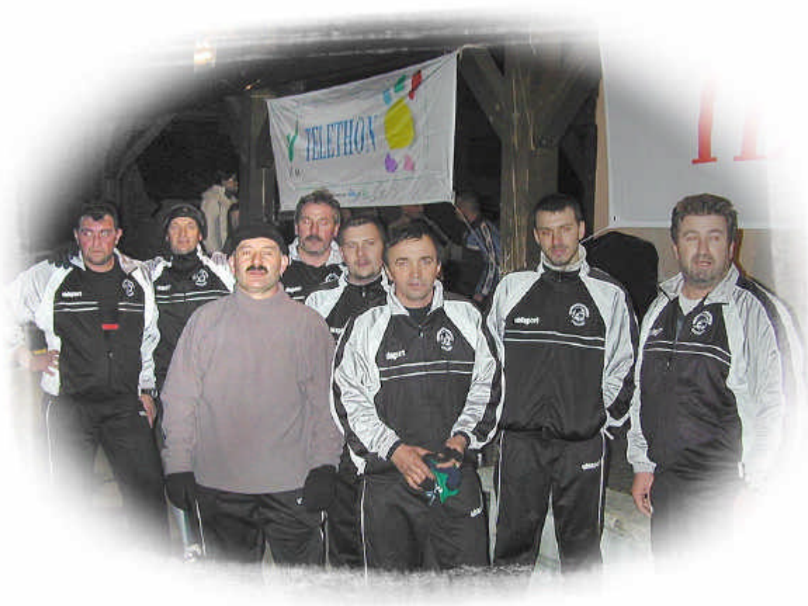
L'équipe des pompiers après un effort remarquable, bravo .

MERCI également à la Fruitière d'Etalans, le Restaurant « Au champ de Foire », l'Alimentation CORDIER, le garage CUSENIER, La Poste pour leurs dons.